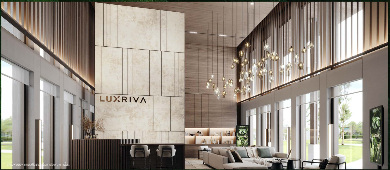
ภาพจำลองจากคอมพิวเตอร์โครงการในสถานที่นั้น