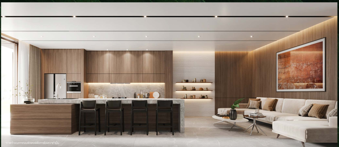
ภาพจำลองจากคอมพิวเตอร์โครงการในสถานที่นั้น