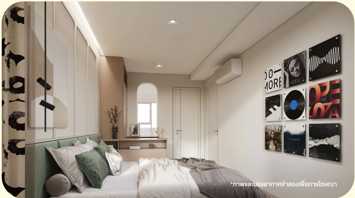
*ภาพและบรรยากาศจำลองเพื่อการโฆษณา