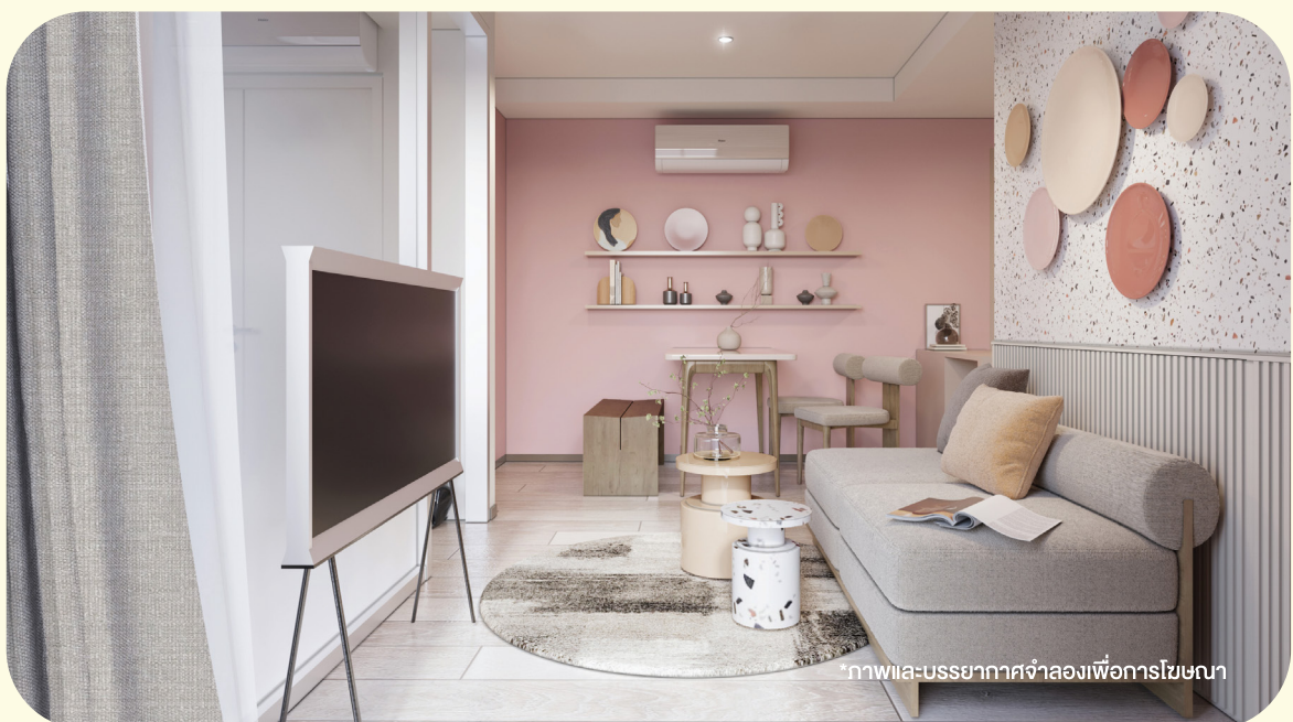
*ภาพและบรรยากาศจำลองเพื่อการโฆษณา