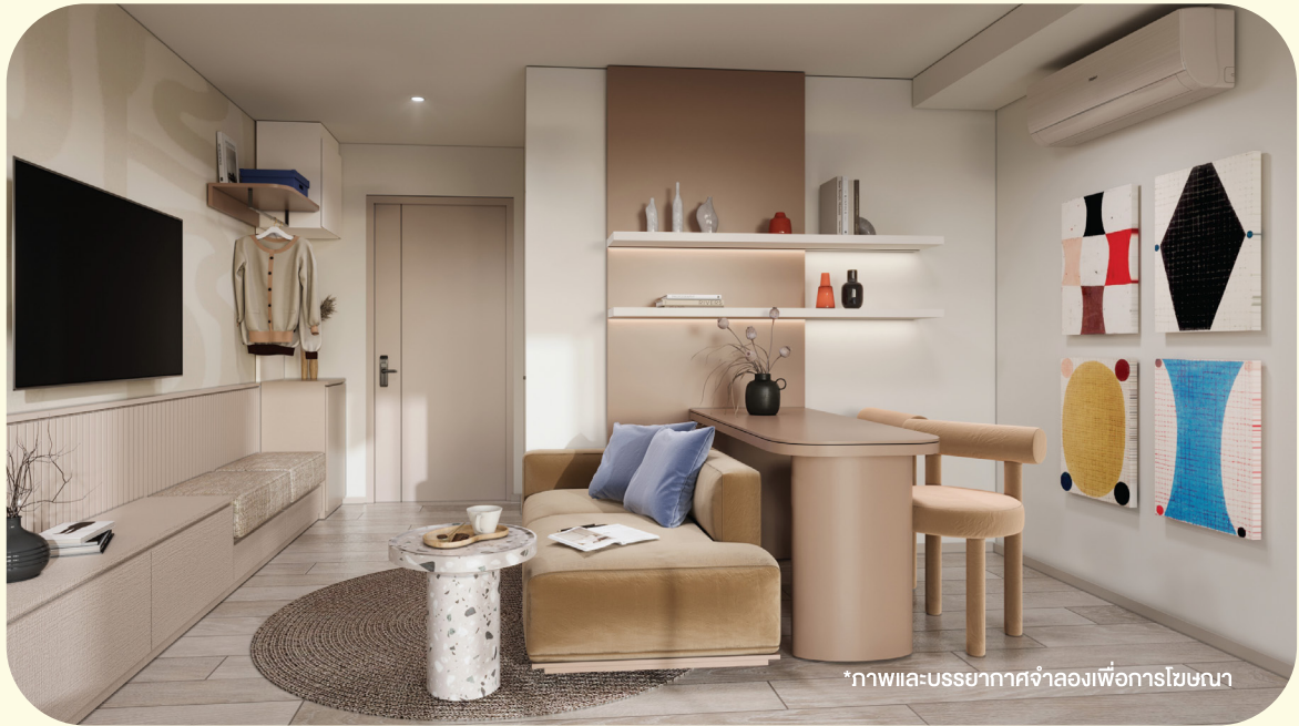
*ภาพและบรรยากาศจำลองเพื่อการโฆษณา